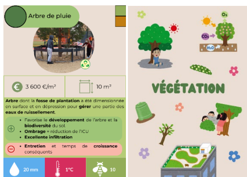
Exemple de la carte aménagement Arbre de pluie de type « végétation » (dos de la carte à droite)